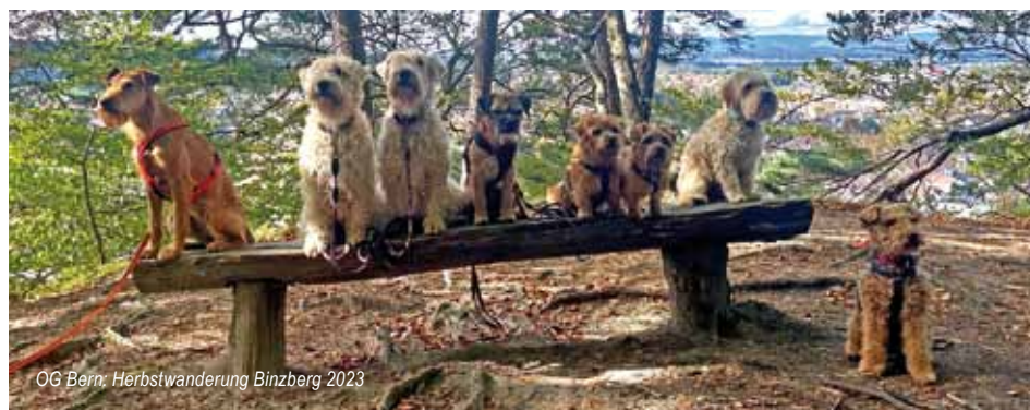
OG Bern: Herbstwanderung Binzberg 2023

Druckerei Alexander Hagenbuch Buchdruckerei Alte Landstrasse 11 5613 Hilfikon 056 622 72 82